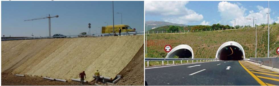
Foto 4 e 5 - Estabilização de taludes de terra para rodovias.