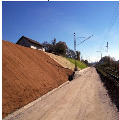
Foto 6 - Estabilização de taludes de terra para ferrovias.