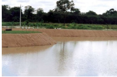
Foto 3 - Proteção de margens de rios e canais.