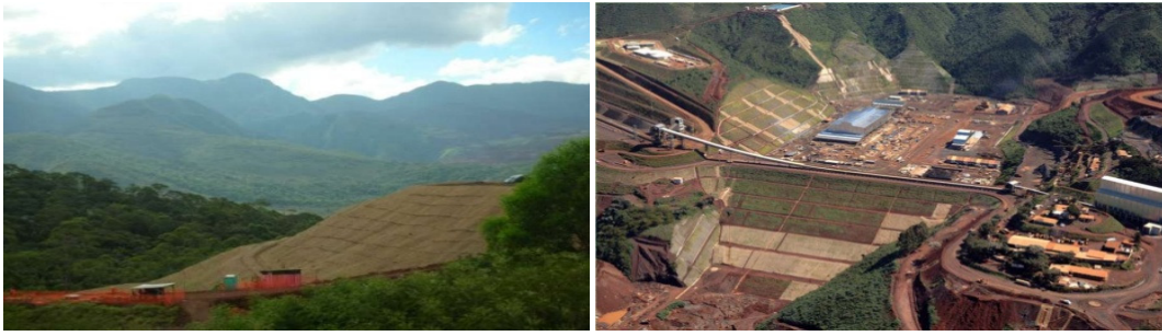
Foto 1 e 2 - Gestão da erosão do solo superficial nas encostas e morros.